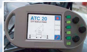
◀ Locatronic system